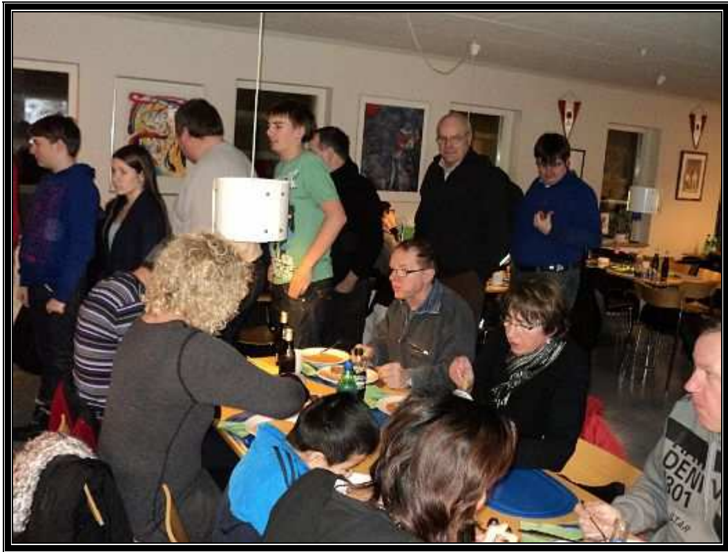
Som Man kan se, er der hurtig opløb ved de varme gryder