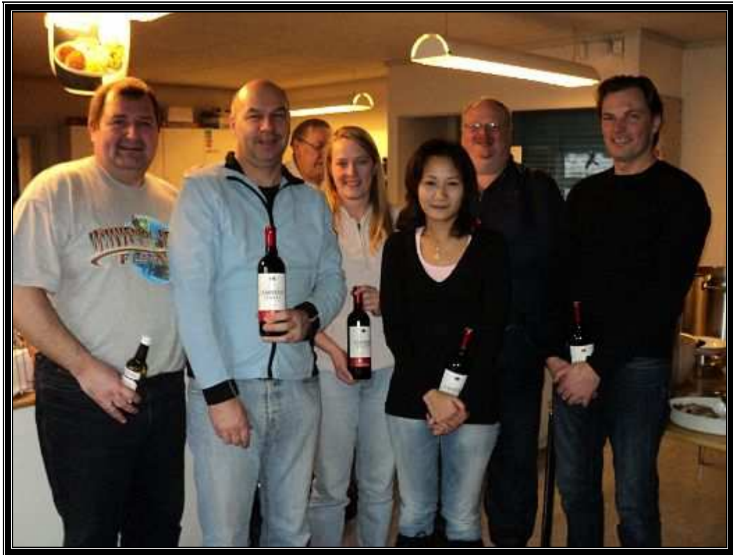
Det største hold ved disse mesterskaber Åben Klasse 2