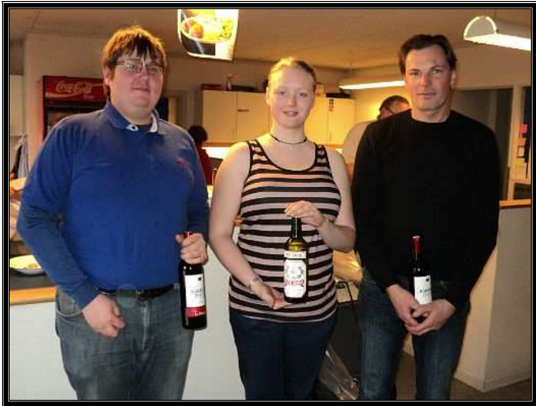
Her har vi de 3 finale deltager ved dette års CUP Skydning